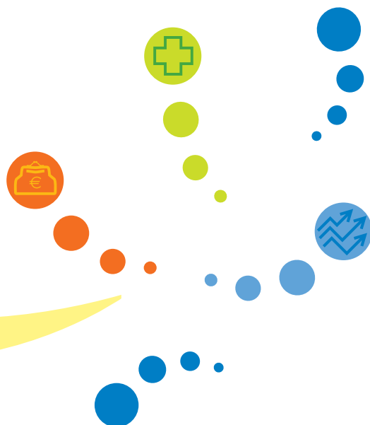
Montants en euros : mensuels pour l'Urssaf et le RSI, semestriels pour la CIPAV.

Les cotisations de retraite de base des professions libérales sont identiques pour toutes les sections de la CNAVPL. Les cotisations de retraite complémentaire et d'invalidité-décès sont différentes selon les sections de la CNAVPL. Consultez la section professionnelle correspondant à votre profession. La CNBF (avocat) a son propre mode de calcul des cotisations retraite et invalidité-décès.